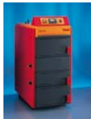
Drvo i solarna energija: Hoval AgroLyt® i Hoval SolKit®