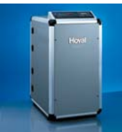
Toplotna pumpa: Hoval Thermalia®

Multifunkcionalan i ravnomeran. Hoval nudi široku paletu rezervoara sanitarne tople vode, adaptiranih za kotlove na gas ili lož ulje. Takođe, Hoval ozbiljno shvata svoju ulogu u širenju svesti o korišćenju obnovljivih izvora energije kao što su drvo ili solarna energija. Svi naši kotlovi i rezervoari su dizajnirani da odgovaraju jedan drugom i na taj način formiraju pravi grejni sistem. Ovo olakšava instalaciju, smanjuje troškove prepravki i doprinosi smanjenju eksploatacionih troškova.