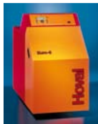
Lož-ulje: Hoval Euro-3