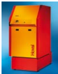
Gas: Hoval UltraGas®